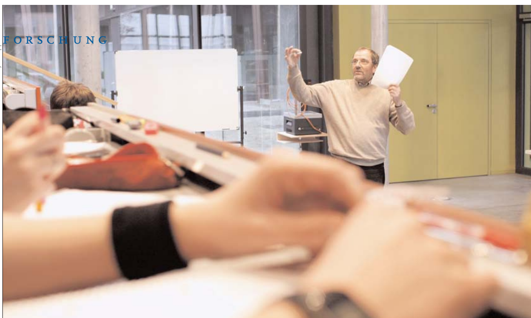
Abb. 2 Das Humboldt-ProMINT-Kolleg leistet einen wesentlichen Beitrag zur praxisorientierten Ausbildung der MINT-Lehramtsstudierenden

Der zum Teil resultierende Mangel an Studierenden in den MINT-Fächern sowie an Absolventen auf dem Arbeitsmarkt hat hier eine seiner Ursachen und macht deshalb ein Umdenken auch in der MINT-Lehrerbildung erforderlich.